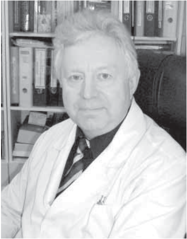
Коростин Михаил Иванович – главный внештатный эксперт – нарколог управления здравоохранения Липецкой области, главный врач ГУЗ «ЛОНД», заслуженный врач России, член областной общественной палаты и общественного Совета при УМВД РФ по г. Липецку, председатель областного общества православных врачей.