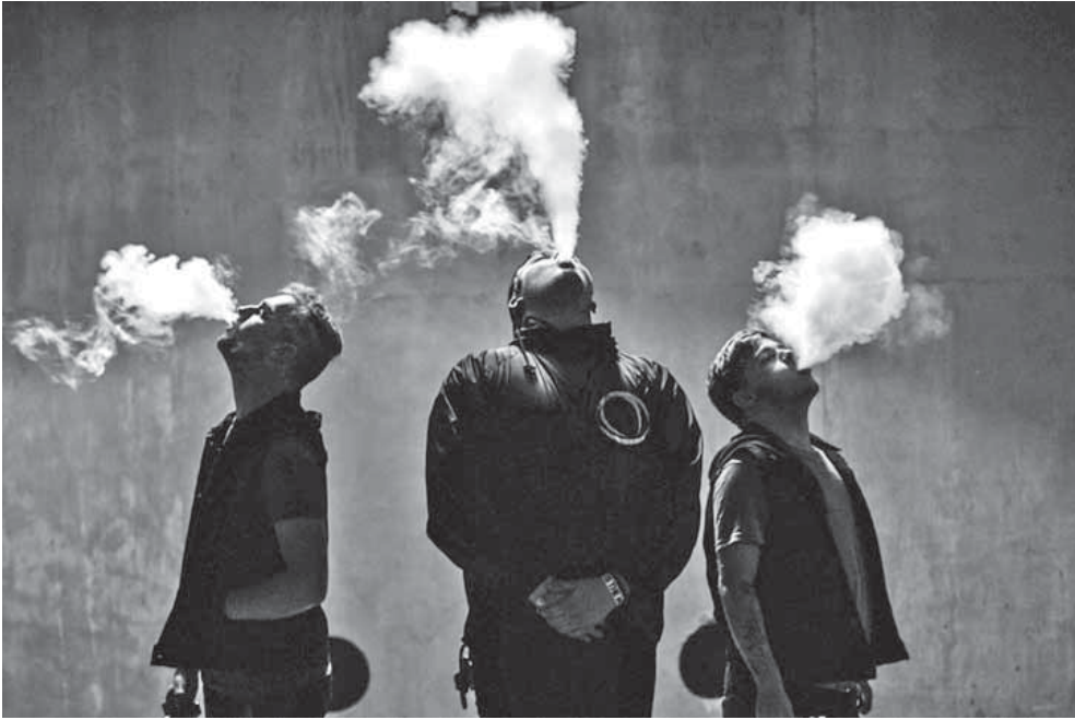
Мы не в курилке, мы в парилке