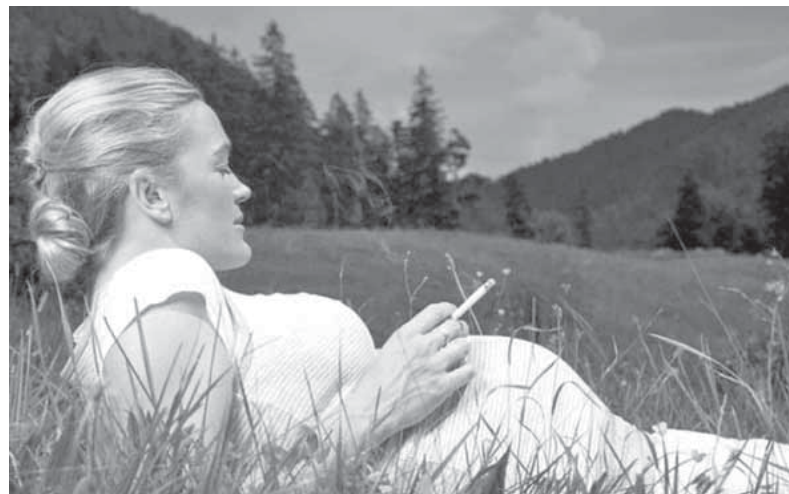
Малыш ещё не родился, но уже прокоптился

приводило к увеличению числа детей, родившихся больными, росту недоношенности и раннему прерыванию беременности. О пассивном курении. Около 80% населения Российской Федерации до недавнего времени подвергались ежедневному пассивному курению табака. Вещества, содержащиеся в табачном дыме, обладают токсичными, мутагенными и канцерогенными свойствами. Побочный дым особенно опасен для детей, так как детский организм беззащитнее перед токсичными веществами. Дым от горящих табачных изделий называют вторичным табачным дымом (ВТД). Основной поток, выдыхаемый курильщиком, содержит сильнейшие канцерогены: радиоактивный элемент Полоний-210, бензол, бутадиен, бензпирен,