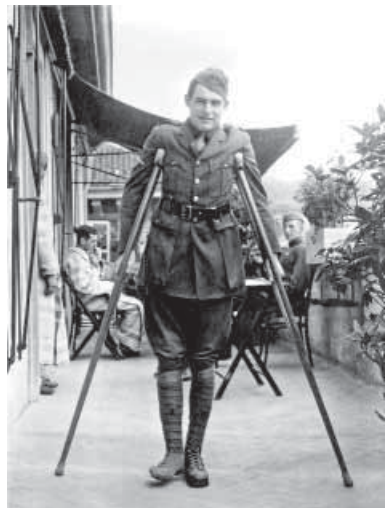
Э. Хемингуэй в отряде Красного креста

Прогрессивный американский писатель – антифашист Эрнест Хемингуэй в 1940 году написал роман «По ком звонит колокол». Эпиграфом к этому произведению была цитата английского поэта XVII века Джона Донна: «Нет человека, который был бы как Остров, сам по себе, каждый человек есть часть Материка, часть Суши; и если Волной снесет в море береговой утес, меньше станет Европа, и также, если смоеет край Мыса или разрушит Замок твой или Друга твоего; смерть каждого Человека умоляет и меня, ибо я един со всем Человечеством, а потому не спрашивай никогда, по ком звонит Колокол: он звонит по тебе». Сам Эрнест Хемингуэй в 1918 году вступил в американский отряд Красного Креста и отправился в Европу, в Италию на итало-австрийский фронт. Он понимал, что чужой бедой не бывает.