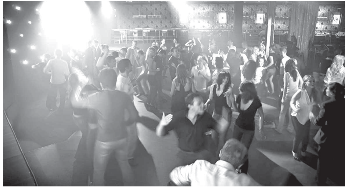
Ночной клуб. Студенты – группа риска. Мы за туманом в тайгу не поедем. У нас и так в голове сплошной туман

возросло до 68%. Эффективность комплексной профилактической деятельности государственных и некоммерческих организаций подтверждается отсутствием вспышечной заболеваемости среди уязвимых групп и формированием приверженности к лечению среди людей, инфицированных ВИЧ, и расширением доступа пациентов к медико-социальным услугам доверенных специалистов, и психологической адаптации к диагнозу, и поддержке родственников, и многими другими аспектами, которые государственными органами без привлечения общественного сектора охватить не представляется возможным. Выбранные направления Липецкого областного отделения общероссийской общественной организации «Российский Крас-