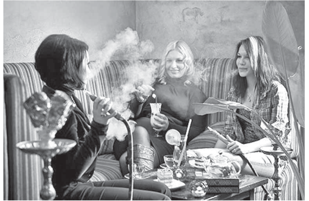
Через кальян можно «подловить» и синегнойную палочку, и туберкулёз, и гонорею с сифилисом

Акролеин раздражает слизистые оболочки глаз и дыхательных путей, вызывает слезотечение, а также проявляет мутагенные свойства. Формальдегид также оказывает воздействие на центральную нервную систему. По заявлению главного нарколога