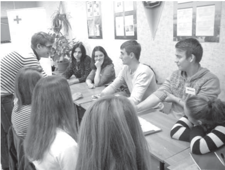
Работа с волонтерами. Если не мы, то кто же?