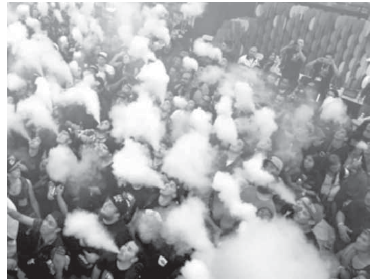
Россия. Клуб вейперов. Не ту страну назвали Гондурасом

А наша Госдума пока еще думает. В Госдуму РФ внесен законопроект о запрете курения электронных сигарет в общественных местах. Обсуждается вопрос об изменениях в рекламе и об усилении административного наказания в виде штрафов от 500 до 150000 руб. за продажу этих изделий несовершеннолетним и их вовлечения в процесс использования электронных сигарет. Есть надежда, что законодотворцы не забудут и про кальяны. Курить не модно, курить не престижно, курить опасно для здоровья и жизни.