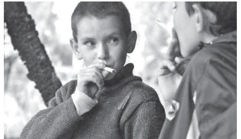
Пока учителя и врачи будут спорить – кому лечить, а кому учить, мы тем временем покурим

При этом курение среди студентов университетов варьирует в диапазоне от 13,8 до 45% в зависимости от регионов, этнических и социальных групп. По усредненным данным, в возрастной группе женщин 19-24 лет доля курящих составляла 37,9%, а среди имеющих высшее образование – 26,6%. В обследованных группах доля курящих девушек в 1,4 раза выше, чем среди юношей. По данным анонимного анкетирования учащихся старших классов и студентов образовательных учреждений Липецкой области по итогам 2015 года: курят менее 5,0% школьников (в 2010г. этот показатель был 25%), среди учащихся ПУ и студентов СУЗов – курят порядка 40,0% (в 2010г. их было 35,4%), среди студентов ВУЗов – курят менее 33,0% (в 2010г. их было 66,7%). В Липецкой области (по данным