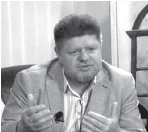
Брюн Е.А., главный нарколог Минздрава РФ: «Электронные сигареты бьют по мозгам и ослабляют человека»

Вся правда о том как нас обманывают. Электронная сигарета. Кальян. В последнее время на смену традиционным сигаретам, курение которых законодательно существенно ограничено, пришла новая «забава» – курение электронных сигарет и кальянов. Агрессивно навязывается мода на электронные системы доставки никотина (ЭСДН). Организуются целые сообщества и клубы любителей электронно – никотинового и кальянового времяпрепровождения. В данный процесс вовлекаются многие подростки. В наши дни вейпы (электронные сигареты) и кальяны без ограничения курят в общественных местах, а вейпы и на детских площадках, и на работе. Нередко это вызывает недовольство со стороны окружающих. Что