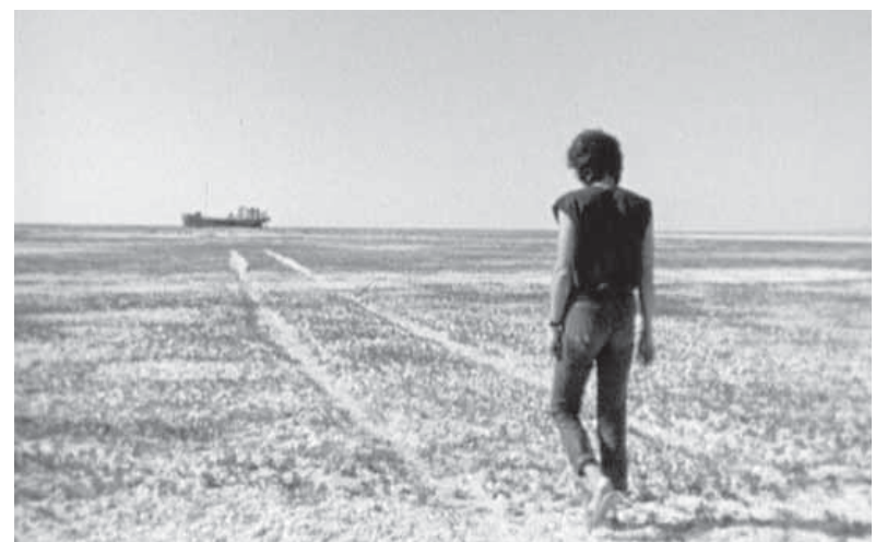
«Игла». Наркомания – дорога в тупик