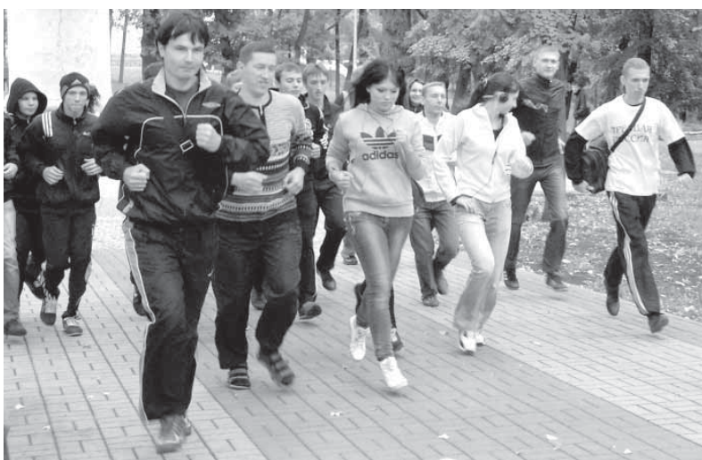
Мы, прежде всего, физкультурники и трезвенники