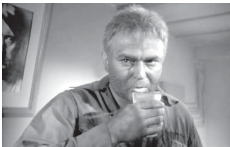
«Судьба человека». Русские после первого стакана не закусывают

В советскую эпоху, при отсутствии телевидения и интернета, особое значение уделялось кинематографу. Помимо развлекательно – досуговой функции на кино возлагалась пропагандистская обязанность. Кино не только скрашивало досуг населения, но и являлось мощным фактором идеологического воздействия. Во всех кинозалах кинотеатров, домов и дворцов культуры той поры обязательным был размещенный на самом видном месте транспарант со словами: «Из всех искусств – важнейшим для нас является кино. В.И. Ленин». Первым эталоном единства идеологического и художественного мастерства стал «Броненосец Потемкин» – немой исторический художественный фильм, снятый режиссером Сергеем Эйзенштейном на киностудии «Мосфильм» в 1925 году. Неоднократно в разные годы признавался лучшим или одним из лучших фильмов всех времён и народов по итогам опросов критиков, кинорежиссёров и публики. В этом культовом фильме не прослеживается ни единая сцена с табаком и алкоголем.