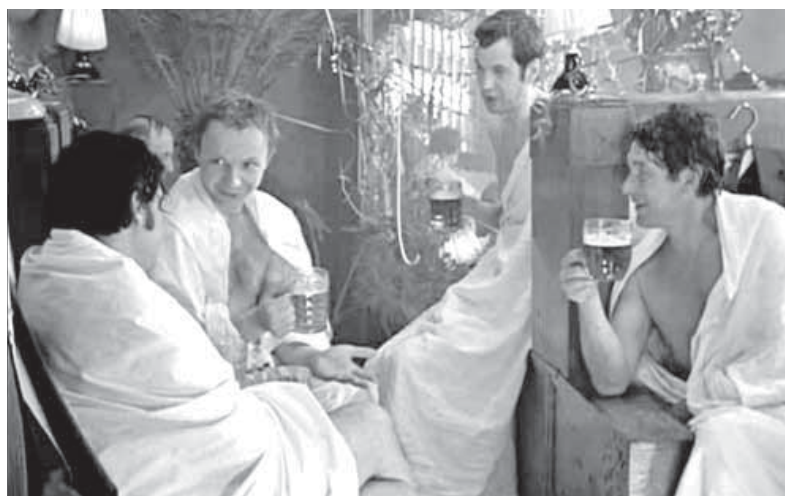
«Ирония судьбы, или С легким паром»: «Есть такая традиция – в канун Нового года память пропивать»