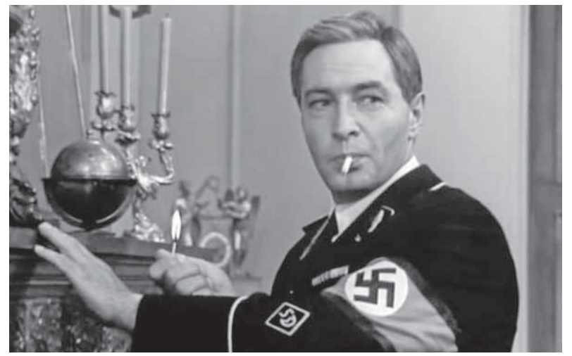
«Семнадцать мгновений весны». Штирлиц без сигареты, что справка без печати

любительских пародий, некоторые реплики из него широко цитировались и превратились в крылатые фразы. Сюжет фильма начинается с того, что перед встречей нового года Женя Лукашин по давно сложившейся традиции отправляется с тремя друзьями (Павлик, Саша и Миша) в баню. В бане друзья изрядно выпивают и, перед тем как разойтись, отправляются в аэропорт, откуда Павлик дол-