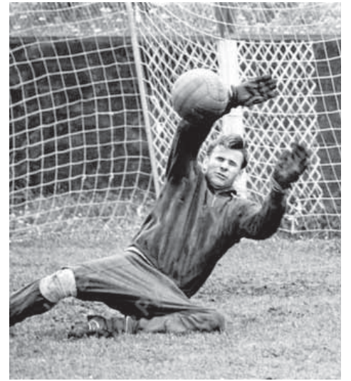
Лев Иванович Яшин

Роковая ошибка великого вратаря. Лучшим вратарем XX века по версии ФИФА признан наш соотечественник Лев Иванович Яшин. Лев Яшин – это легенда не только отечественного, но всемирного футбола, олимпийский чемпион, чемпион Европы 1960 года, пятикратный чемпион и трехкратный обладатель кубка СССР, обладатель «Золотого мяча» (единственный среди вратарей)