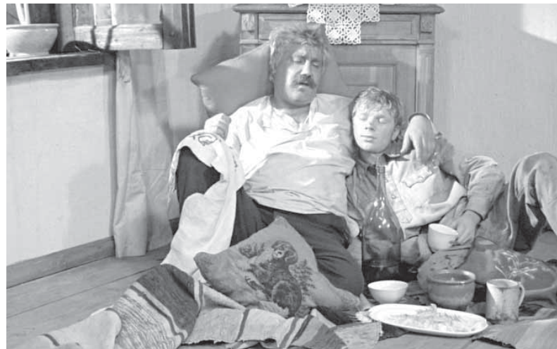
«Белое солнце пустыни», «Кавказская пленница»: «А кто здесь пьёт, а что здесь пить?»

с 1952 года, и основывается на мнении более чем ста кинематографов и (с 1992 года) режиссёров из разных стран мира, «Броненосец „Потёмкин“» присутствовал каждый раз, занимая места с четвёртого по седьмое. Кроме него, всегда попадала в этот список только одна картина – «Правила игры» Жана Ренуара. В 2012 занял 11 место, не попав в список.