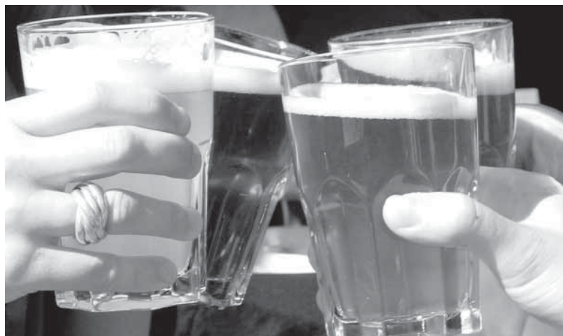
Спортивные болельщики поднимают бокалы в честь своих кумиров. Все победы и поражения «обмываются»