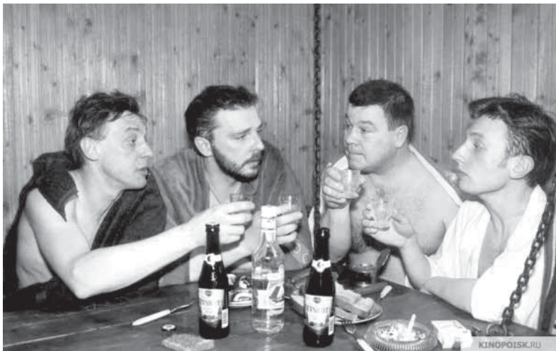
«Улицы разбитых фонарей»: «Это дело нужно обмыть»

ветские колхозники. Чурикова просто потрясла! Удивительно, как эта интеллигентнейшая женщина перевоплощается в колхозницу-коммунистку-алкоголичку Асю. А в целом после просмотра фильма становится очень грустно. Поголовно пьющая деревня, в которой Ася Клячкина вовсе не исключение, а горькая истина.