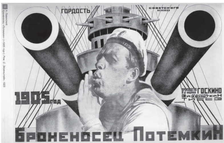
«Броненосец Потемкин». Гордость советского и мирового кинематографа, снят без сцен курения и употребления алкоголя