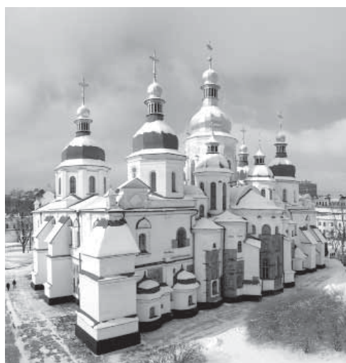
Софийский собор Киева построен в 1037 году при князе Ярославе Мудром