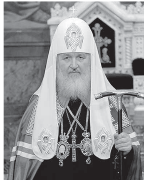
Патриарх всея Руси Кирилл – поборник трезвости наших дней