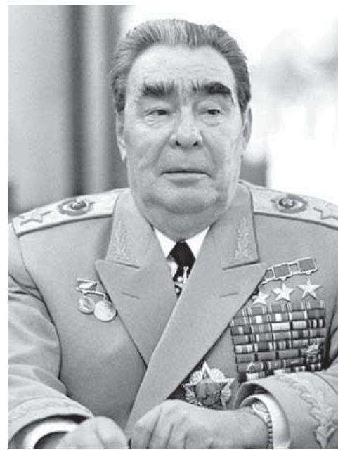
Леонид Ильич Брежнев (1906-1982). В годы своего правления довел СССР до беспредельного пьянства. При нем было резко увеличено количество медвытрезвителей, появились наркодиспансеры и ЛТП

В середине 60-х годов СССР был до краев залит низкосортными плодоягодными винами. Душевое потребление абсолютного алкоголя возросло до 10 килограммов в год, не считая самогона. Пьянство незаметно стало доминирующей потребностью населения. Предложение силой брало спрос. Доходы от реализации спиртного в период правления Л.И. Брежнева возросло со 100 до 170 миллиардов рублей в год.