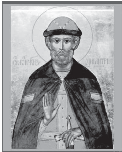
Князь Дмитрий Донской (1350-1389), канонизирован в РПЦ в ранг святых