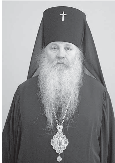
Митрополит Липецкий и Задонский Никон, радетель трезвости на липецкой земле

В 2006-2007 годах «Медицинская газета» публикует ряд статей ведущих наркологов России по вопросу, относящемуся не просто к наркологической ситуации, а именно ситуации алкогольной. «МГ» № 22 от 28.03.2007 года печатает статью: «Где спасительный