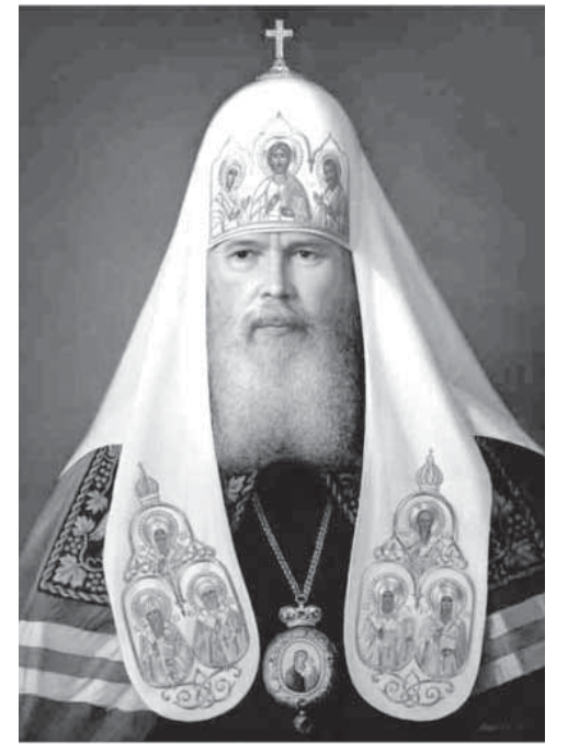
Патриарх Алексий II (1929-2008)

При этом православные врачи просто обязаны донести слова ныне покойного Патриарха Московского и Всея Руси Алексия II, высказанные им в газете «Пока не поздно» в январе 2001 года, до всех своих коллег: