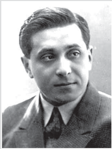
М.М. Зощенко (1894-1952)

В продолжение темы объявленного 2015 года – годом Русской литературы. Читателям предлагается рассказ Михаила Михайловича Зощенко «Сильное средство» и фельетон «Домашнее средство».