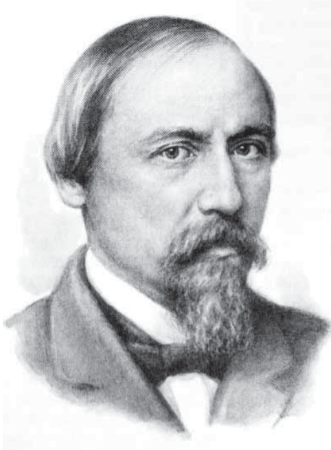
Николай Алексеевич Некрасов (1821-1878)

К 1985 году назрела жизненная необходимость ограничения производства и реализации алкоголя в объеме 30%. Ни о каком сухом законе речи не шло. Как это начиналось и чем это закончилось, многие отлично помнят. При всем при этом, не следует забывать, что в те годы у нас в наркологическом диспансере ежегодно умирали 4-5 человек, в последнее время их ежегодная численность приближалась к 60. Белая горячка регистрировалась у 45-50 человек