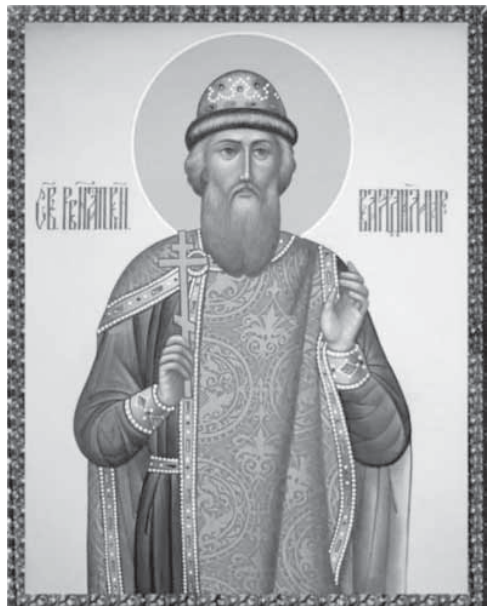
Князь Владимир – креститель Руси (960-1015). Канонизирован в РПЦ в ранг святых