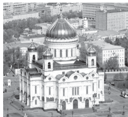
Храм Христа Спасителя построен в честь победы над Наполеоном в 1883 году на пожертвования народа. Разрушен большевиками в 1931 году, заново восстановлен в 2000 году