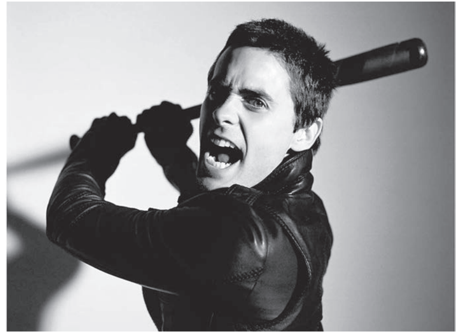
Выпить для запаха, а дури своей хватает

Атипичные варианты алкогольного опьянения оцениваются в рамках осложненного алкогольного опьянения. Так, у ряда лиц алкоголь может вызывать не типичную эйфорию (веселое настроение), а, наоборот, подавленность, депрессию. Депрессивная форма опьянения может сопровождаться тревогой, возбуждением, попытками самоубийства, порой проявлениями угрюмости, раздражительности, озлобленности.